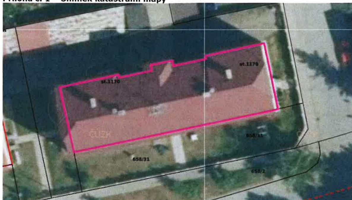
Příloha č. 1 – Snímek katastrální mapy